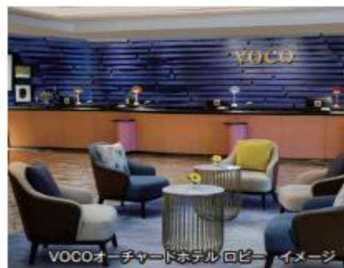
VOCOオーチャードホテル ロビー イメージ