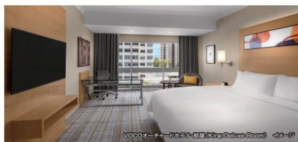
VOCOオーチャードホテル 部屋(King Deluxe Room) イメージ