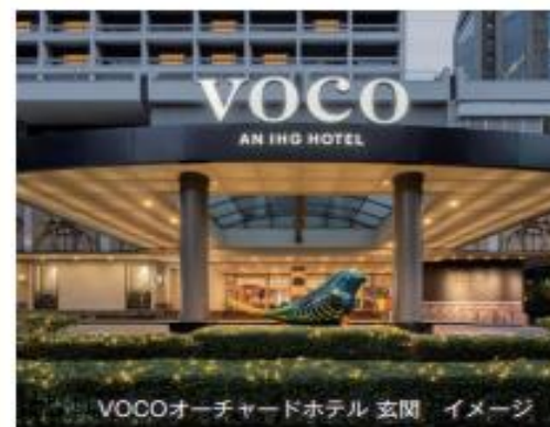
VOCOオーチャードホテル 玄関 イメージ