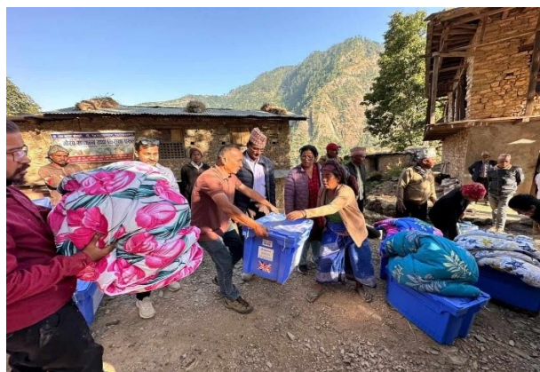
被災地で支援物資の配布を行っている写真

2023 年 11 月 3 日にネパール西部のジャジャルコットを震源にネパール西部を襲ったマグニチュード 6.4 の地震が発生しました。地元当局によると、これまでに 153 人が死亡、338 人以上が負傷し、死傷者の半数近くは、子どもであると報告されています (UNICEF)。当 2820 地区は、2011 年の東日本大震災発生時に、ネパール 3292 地区から多額の義援金や茨城県立こども病院に医療機器を寄贈して頂いたこともあり、3292 地区ジャジャルコット地震支援本部に、地区内会員から頂いた 920,500 円を義援金として 11 月 29 日に送金しました。